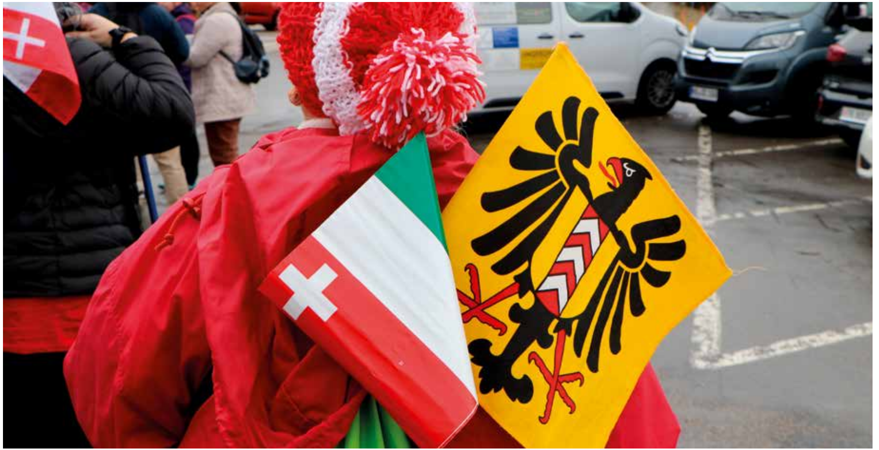
Le sentiment d'appartenance à la République et canton de Neuchâtel existe encore, du moins lors de la marche du 1 er mars.