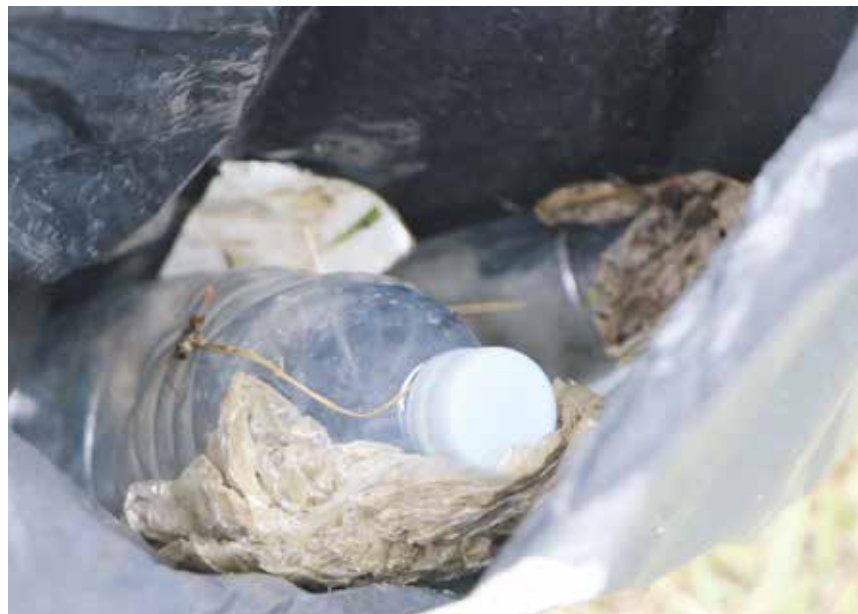
Le Seyon aura droit à son opération annuelle de nettoyage le 23 mars.

Si vous désirez nous faire part d'un événement qui se déroule au Val-de-Ruz, faites-nous parvenir vos informations détaillées par courriel à l'adresse redaction@valderuzinfo.ch . Le délai d'envoi des textes pour le numéro 318 (à paraître le 20 mars) est fixé au mardi 14 mars . Le libellé de l'annonce est du ressort de la rédaction. Les lotos, matches aux cartes, cours particuliers, ne sont pas référencés dans l'agenda. Pour ce genre de manifestation, il faut se référer à la rubrique petites annonces sur www.valderuzinfo.ch .