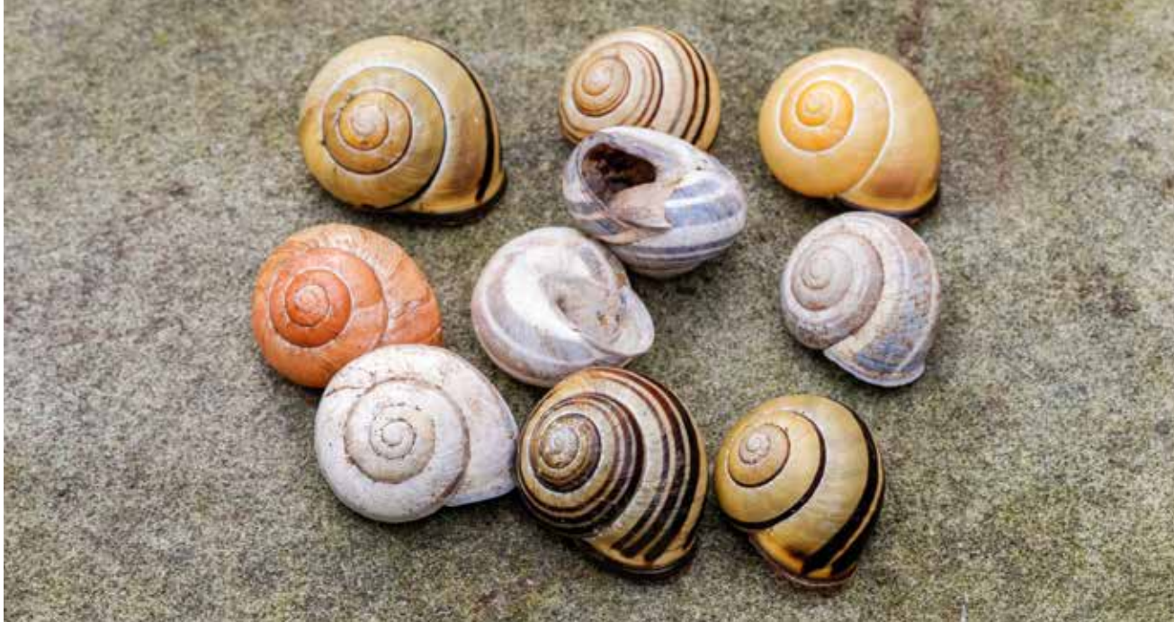
Le look de l'escargot des haies est facilement reconnaissable.

Pro Natura a désigné l'escargot des haies, animal de l'année 2025. Si elle n'est pas menacée de disparition, cette espèce contribue à la régénération des sols. Elle est à protéger et non pas à détruire comme une bête indésirable. Elle est répandue au Val-de-Ruz sauf sur les hauteurs.