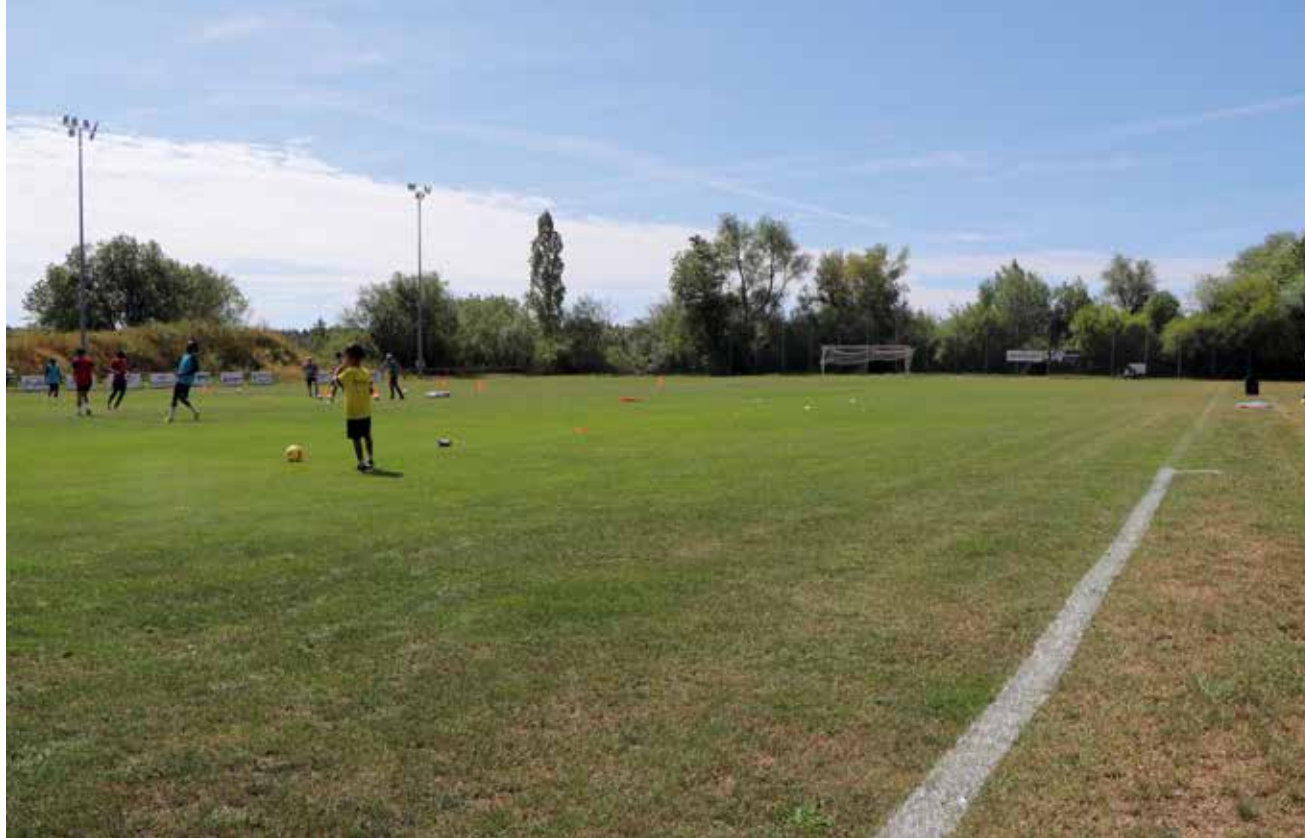
Mais jusqu'à quand le FC Coffrane pourra-t-il s'entraîner à La Paulière?.

Le club de football de l'ouest du Val-de-Ruz a retiré sa seconde garniture du championnat de 2 e ligue neuchâteloise. Et surtout, ses dirigeants constatent avec inquiétude que le dossier des nouvelles infrastructures aux Geneveys-sur-Coffrane s'enlise.